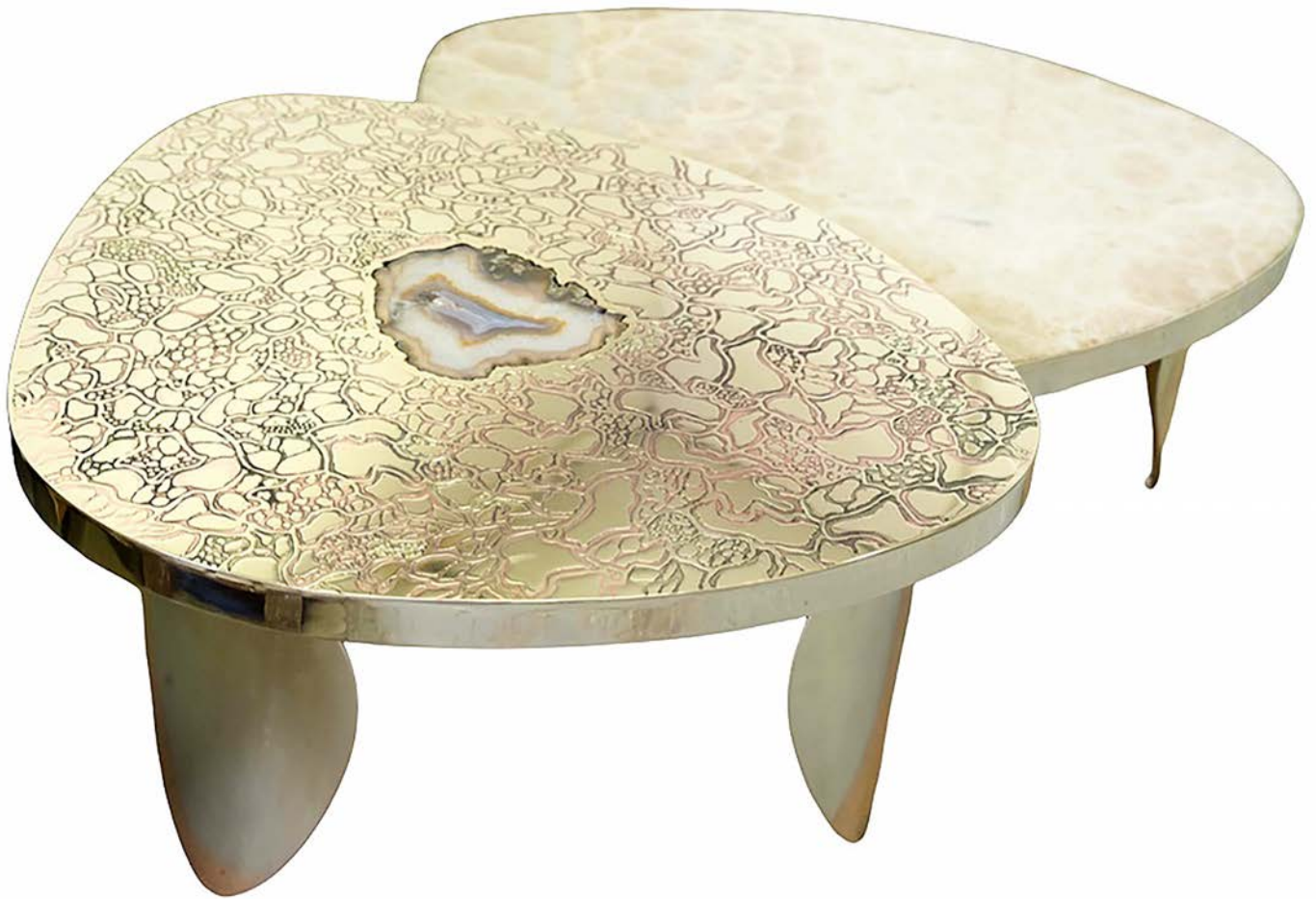
TABLE FOLIUM | 2021

TABLES BASSES GIGOGNE PLATEAU LAITON POLI MIRROIR ET ONYX MOTIFS RÉALISÉ À L'ACIDE PIÈTEMENT LAITON BROSSÉ